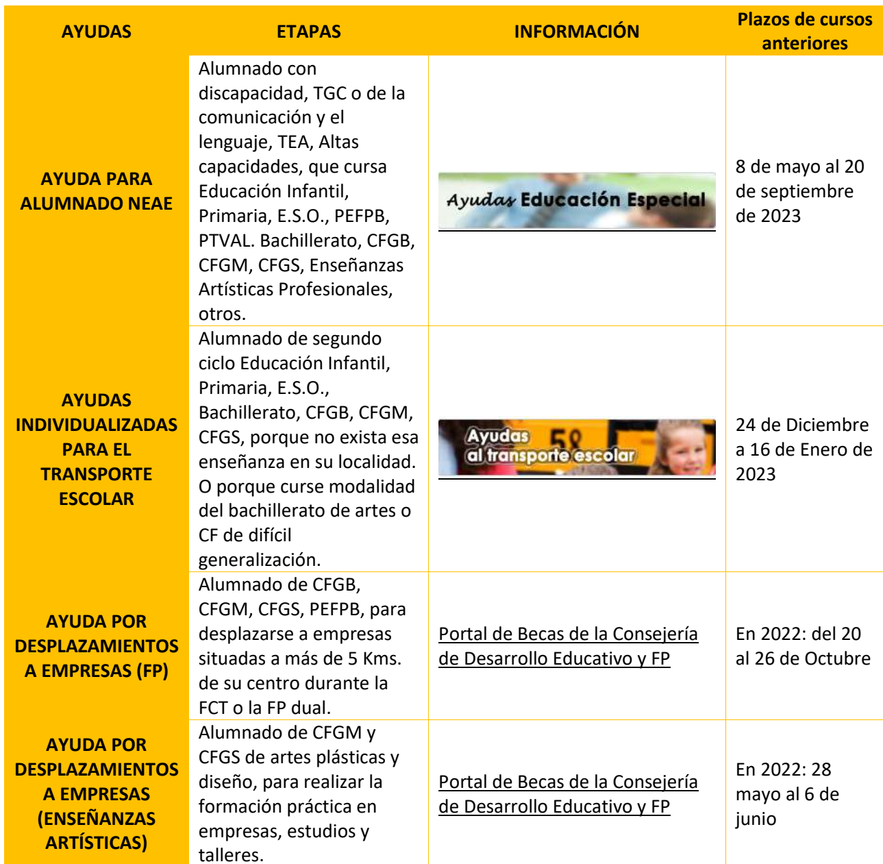
Tabla 27 Ayudas al estudio