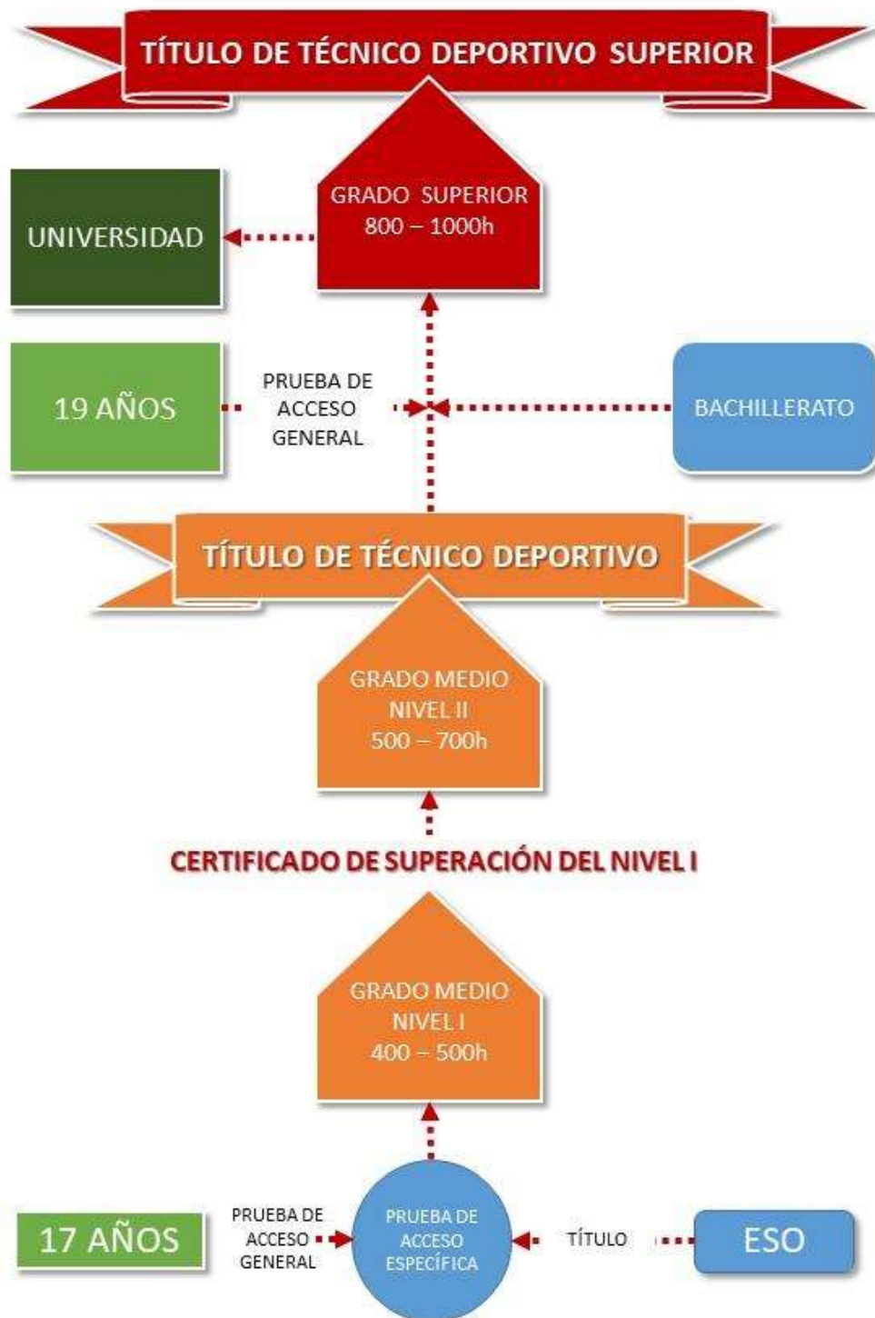
Ilustración 3 EDRE