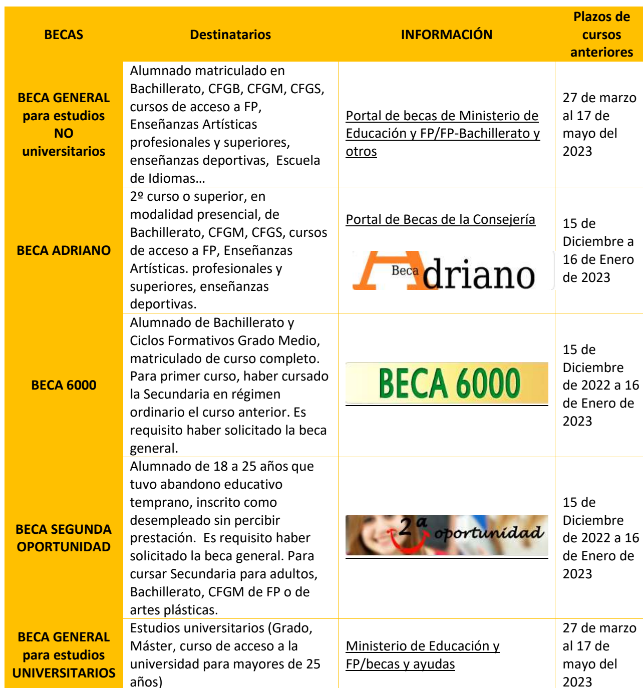
Tabla 26 Becas generales